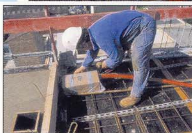
Fixation sur treillis avant enrobage

UNE ÉCONOMIE ET UN GAIN DE TEMPS CONSIDÉRABLES À LA MISE EN ŒUVRE !