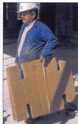
Transport aisé par paquets de 20 boîtes

SYSTÈMES POUR PLANCHER CHAUFFANT ET RAFFRAICHISSANT RÉSEaux HYDROCÂBLÉS CHAUFFAGE-SANITAIRE-CLIMATISATION