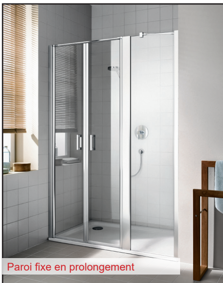
Paroi fixe en prolongement

Verre de sécurité haute qualité selon norme EN 12150. Épaisseur 5 mm