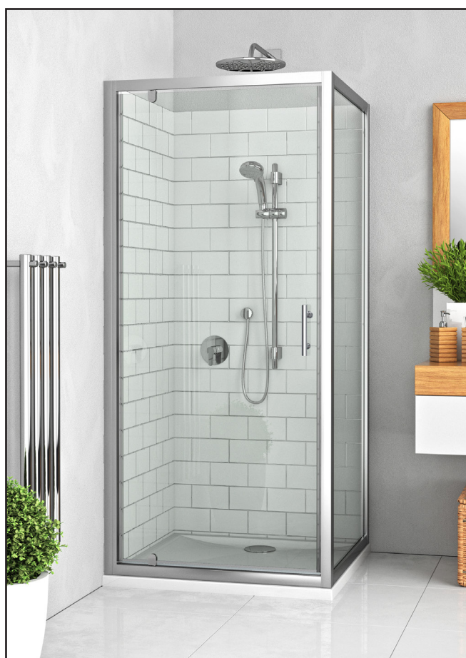
Montage en angle avec paroi fixe EI FIX