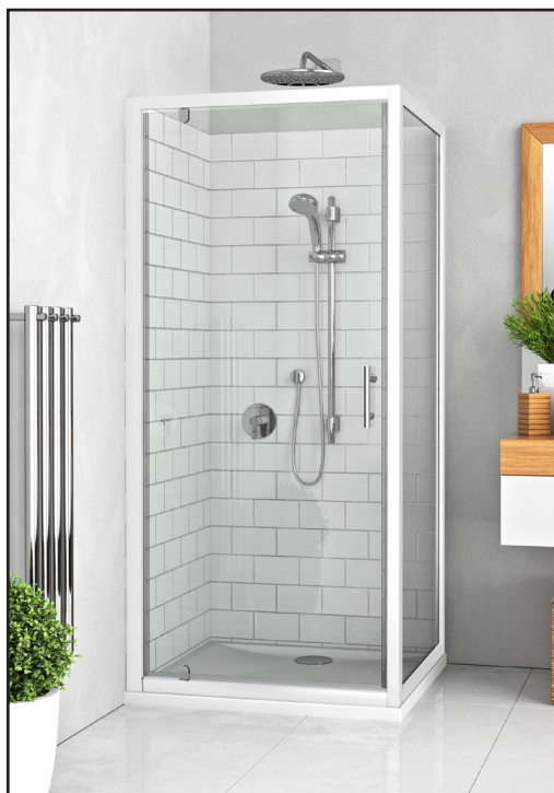
Disponible en BLANC