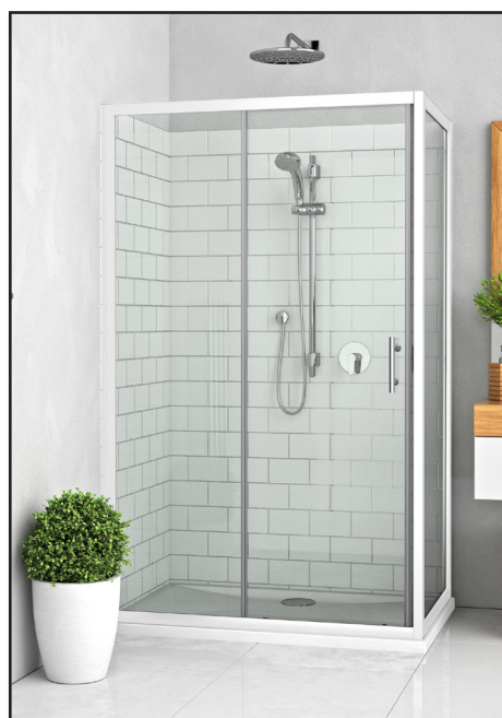
Disponible en BLANC