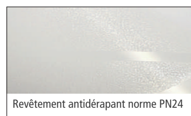
Revêtement antidérapant norme PN24