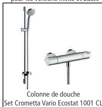
Colonne de douche Set Crometta Vario Ecostat 1001 CL