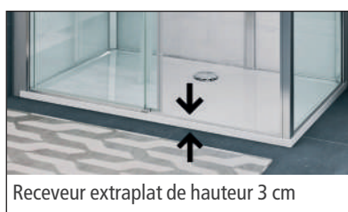
Receveur extraplat de hauteur 3 cm