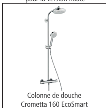
Colonne de douche Crometta 160 EcoSmart